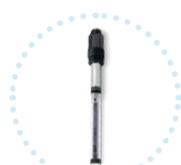
Sonde CLF Mesure du chlore libre #ULTIMACLF

Grace à une connectique unique pour une évolution technique dans le temps.