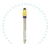
Sonde Redox Mesure en mV #ULTIMARX